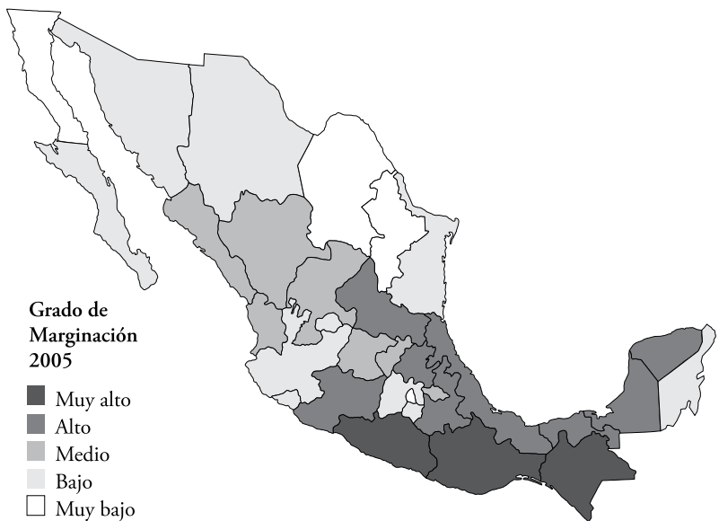
Mapa 2 Grado de Marginación en los Estados de la República Mexicana, 2005